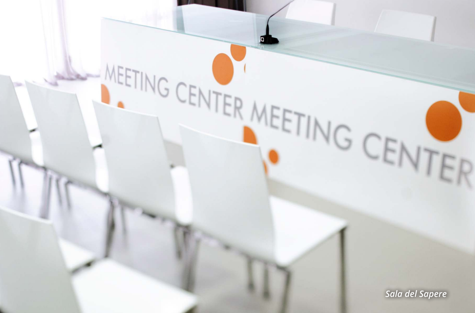
Sala del Sapere